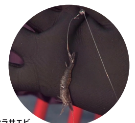
シラサエビ 写真の様に尻尾を切り、第一節を通すように刺します。