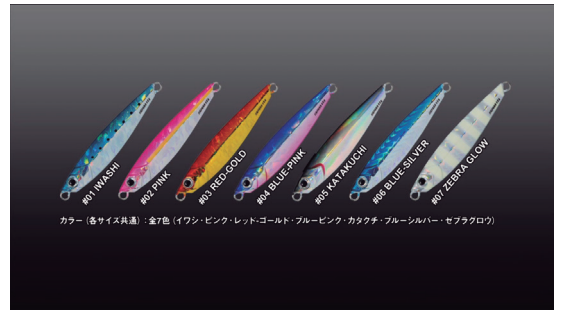
カラー（各サイズ共通）：金7色（イワシ・ピンク・レッド・ゴールド・ブルー・ピンク・カタチ・ブルー・シルバー・セブクロウ）

大型青物をも魅了するスライドアクションが特徴のジグバラ・セミロング。やや長めのシルエットから生まれるヒラを打ちながらの強烈なフラッシングはあらゆるフィッシュイーターの捕食のスイッチをオンにします。基本のワンピッチだけでなく緩急をつけたコンビネーションジャークにも完全対応。