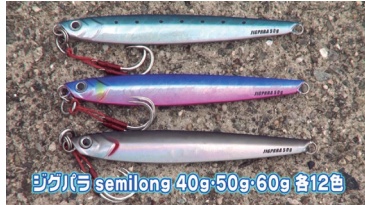
ジグバラ semilong 40g・50g・60g 各12色

あらゆる状況に対応する。空気抵抗の小さいコンパクトシルエットが生み出す圧倒的な飛距離。またハイビッチからスローまであらゆるジャークに対応する引き重り感の少なさと、喰わせのタイミングを誘発させやすいセンターバランスは使い手を選びません。ド定番ジグの決定版です。