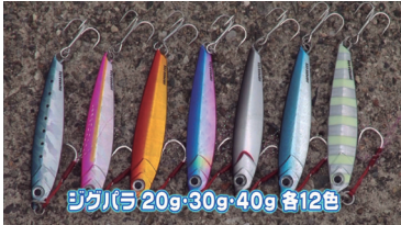
ジグバラ 20g・30g・40g 各12色

あらゆる状況に対応する。空気抵抗の小さいコンパクトシルエットが生み出す圧倒的な飛距離。またハイビッチからスローまであらゆるジャークに対応する引き重り感の少なさと、喰わせのタイミングを誘発させやすいセンターバランスは使い手を選びません。ド定番ジグの決定版です。