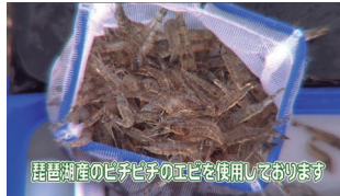
琵琶湖産のビチビチのエビを使用しております

■フィッシングマックスオリジナル シラサエビ 元気のよい琵琶湖産のシラサエビを使用。