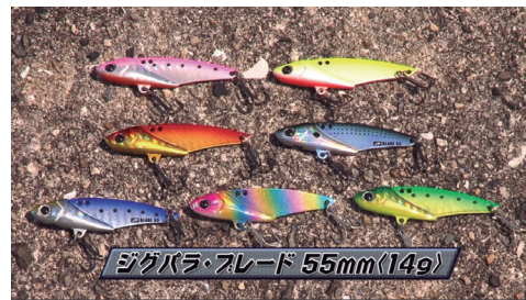
ジグバラ・スレード 55mm(14g)

思い切り投げて、ただ巻くだけで魚の捕食スイッチにハイアピール。日本中のソルトフィッシャーが狙えます。巻き抵抗をほどよく抑えつつ簡単には浮き上がらず、しっかりと波動を起こす絶妙な水押し感はレンジキープ必須のブレードゲームに最適です。 □100mm/35g □100mm/27g □75mm/23g □75mm/18g □55mm/14g □各7色